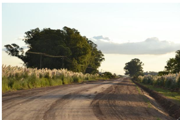
Camino a la escuela

La escuela rural N°29 “Almirante Guillermo Brown” se encuentra a seis kilómetros de la cabecera del partido de Navarro. Esta zona se encuentra dividida en 9 cuarteles, la escolita pertenece al cuartel III. La mitad del camino que conduce a ella es de tierra y está bordeado de una hermosa planta que se llama cola de zorro. Desde la escuela se ve el horizonte. Los días de invierno, el sol asoma justo cuando los chicos entran a la escuela y la maestra cuenta que miran el amanecer hasta que el sol aparece plenamente y les encandila los ojos. Siempre lo ven diferente, a veces como una naranja, otras, rodeado de nubes, pero todos los días lo viven como una experiencia maravillosa.