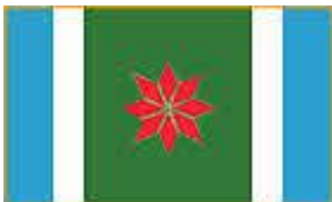
Bandera de Navarro Buenos Aires

Coincidir Asociación Civil contribuye así al desarrollo cultural de las comunidades rurales de la Argentina.